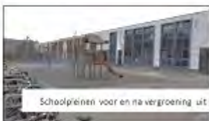
School I: Baseline