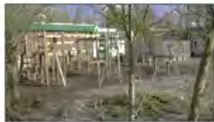
School H: After greening