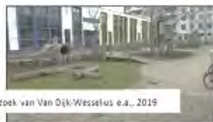
School I: After greening