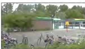
School H: Baseline

naar de effecten van een meer langdurige, dagelijkse blootstelling aan natuur. In een uitgebreide studie in Spanje